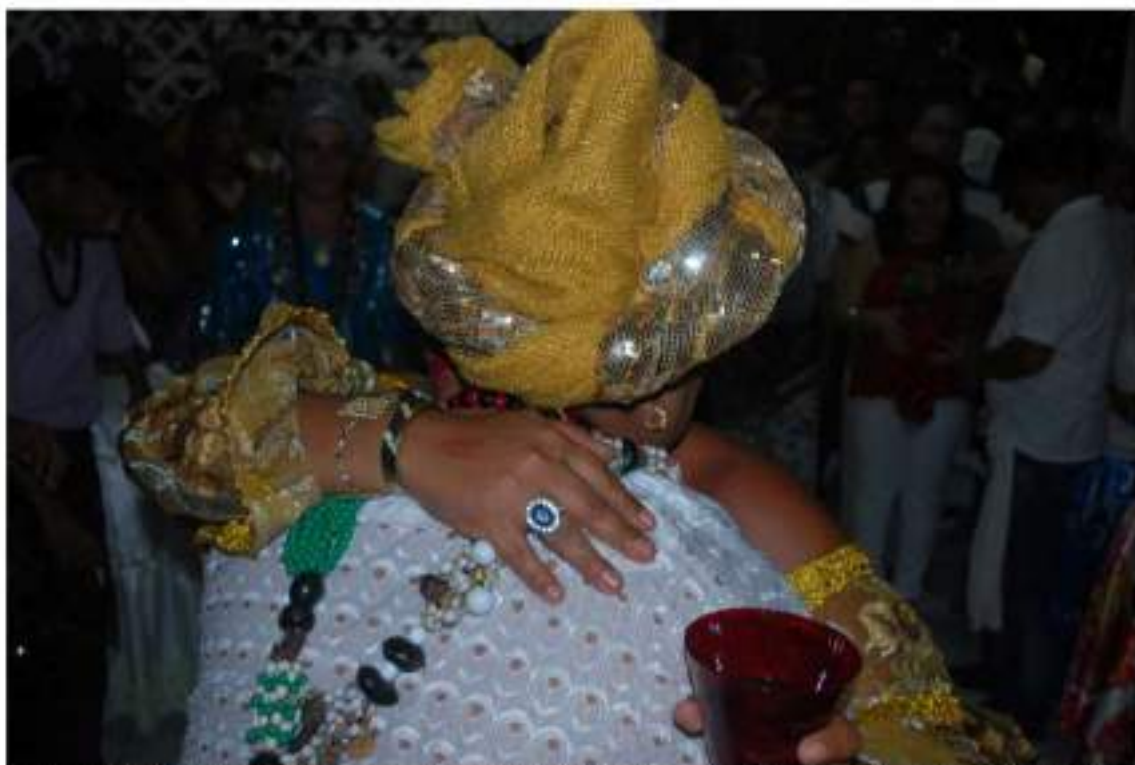
Fotografia 11 – Ainda no salão, a mestra cumprimenta os participantes presentes. A primeira a ser abraçada é a liderança da família. Terreiro de Jurema-Mestre Aroeira, bairro de Cidade Nova, Natal-RN.